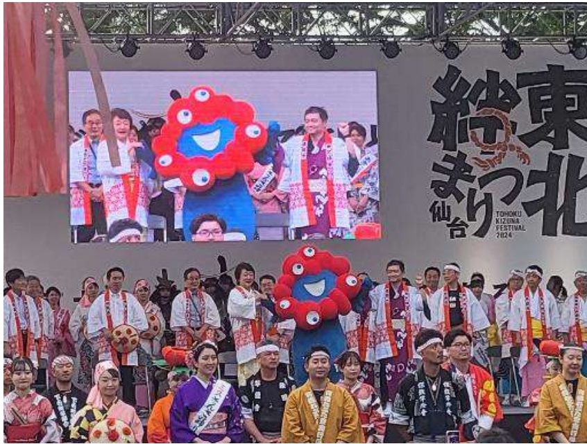
東北絆まつりの閉会式の様子（ミyakumiyakuからみて右手側は郡仙台市長）@仙台

□ 5/31(金)、 海外向けの日本政府の対外広報誌 （「 HIGHLIGHTING Japan 」）において、 万博関連の紹介記事を掲載 。 日本政府館、タイやオーストラリアのパビリオン、万博会場で体感できる次世代技術 （AI スーツケース等）などを紹介。