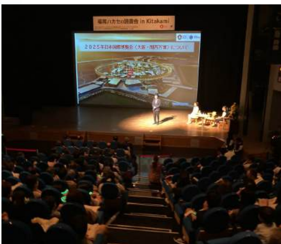
300名以上の親子にご参加いただいた、「福岡八カセの読書会 in KITAKMI」(於) 岩手県北上市