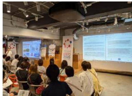
「自動翻訳システム by TOPPAN RemoteVoice」 デモンストレーション