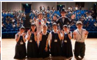
(左) 福岡プロデューサー作「ホテルの光がつなぐもの」の読書会 (右) 自見はなこ国際博覧会担当大臣と福岡プロデューサー、読書会に参加した岩手県立黒沢尻北高等学校の放送部の皆さん