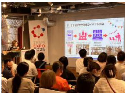
「TEAM EXPO 2025」プログラム参加者の活動紹介